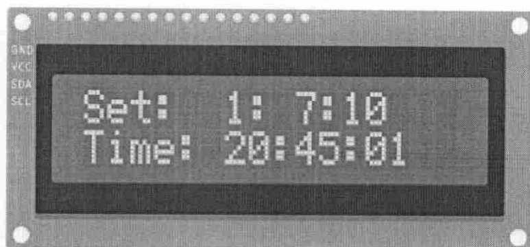
Рис.1. Дисплей LCD 1602