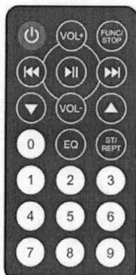
Рис 2 . ИК-пульт